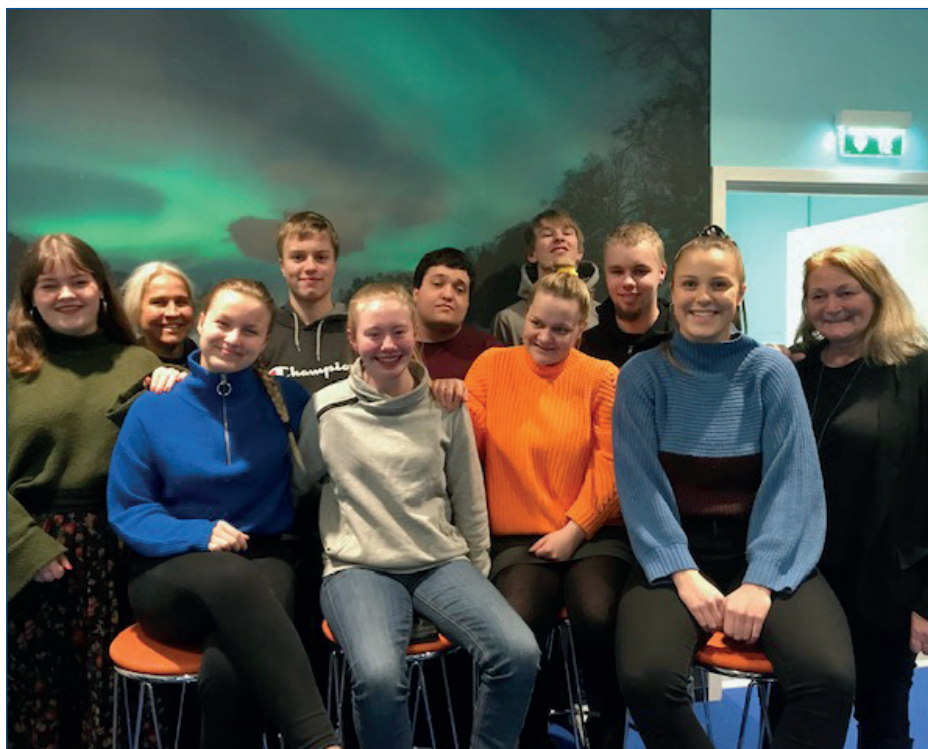
Helgesamling med Ungdomsrådet i Bodø.

Ungdomsrådet gjennomførte i alt fire møter i 2019. I tillegg hadde ungdomsrådet to helgesamlinger i 2019 - én intern 29.–31. mars og en nasjonal helgesamling (Camp revolution) for alle ungdomsrådene, 13.–15. september i Trondheim. På den nasjonale samlingen i Trondheim ble det også gjennomført en regional samling for alle ungdomsrådene i Helse Nord.