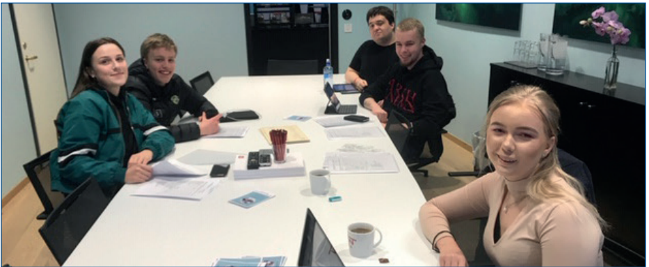
Medlemmer av ungdomsrådet på helgesamling i april.

Gode overganger fra barne- til voksenorienterte tjenester er et arbeid ungdomsrådet har jobbet kontinuerlig med. Vi vil nå presentere prinsippene for gode overganger fra barne- til voksenorienterte tjenester, utarbeidet av ungdomsrådene ved Nordlandssykehuset, UNN og Finnmarkssykehuset.