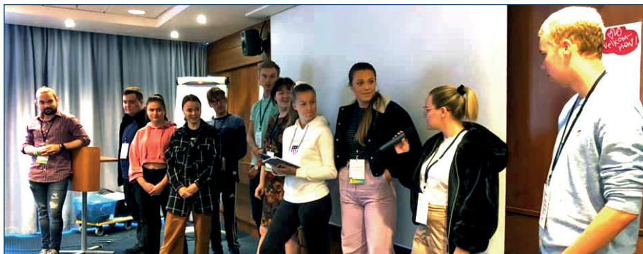
Ungdomsrådet forteller om sitt arbeid på nasjonal helgesamling i Trondheim.

Hovedfokus i foredragene har vært brukermedvirkning, kommunikasjon med ungdom, prinsipper for gode overganger og hva som er viktig for ungdom i møte med helsevesenet.