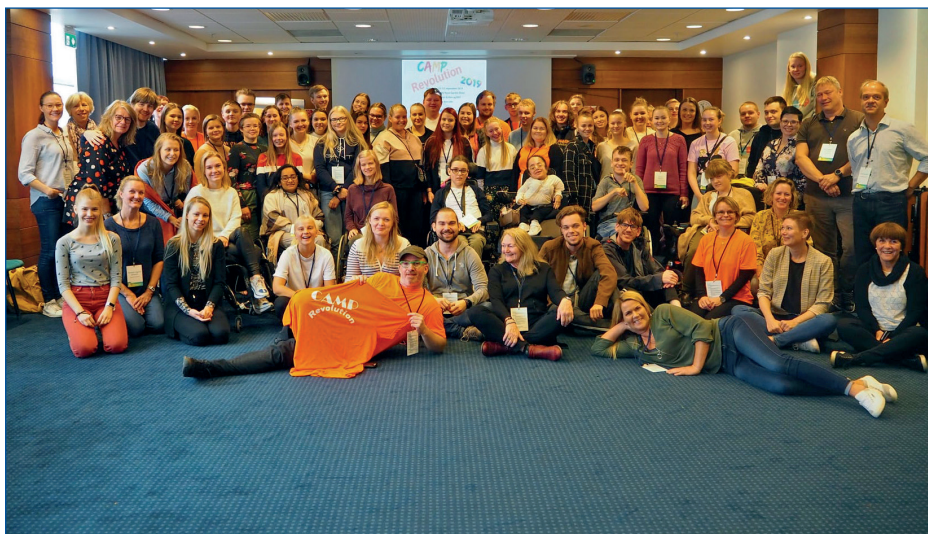
Alle deltakerne på Camp Revolution, i Trondheim.